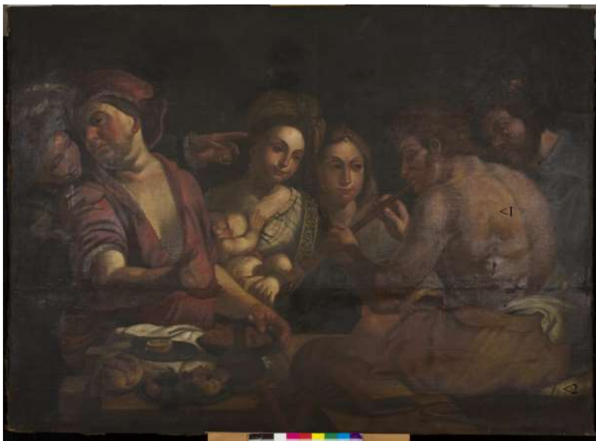
Místa s odběru vzorků

Průzkum obsahuje 4 strany textu a 6 fotografií.